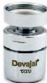
Adapter M22-M24 zusätzlich